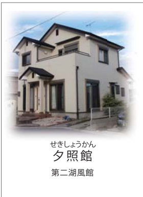
せきしょうかん 夕照館 第二湖風館