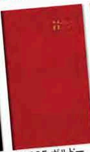
50695 ホルード ※金箔押しをした特殊紙に透明 カバーをかかげました。