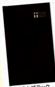
50694 ブラック ※金箔押しをした特殊紙に透明 カバーをかかげました。