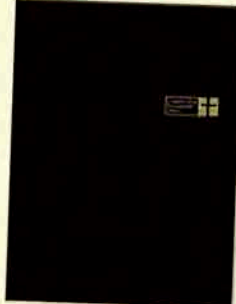
50701 ブラック ※金箔押しをした特殊紙に製地の透明カバーを かかげました。